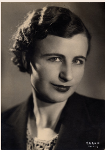
Mélinée Manouchian

Ils sont rentrés au Panthéon le 21 février 2024, symboles d'une population immigrée engagée dans la Résistance.