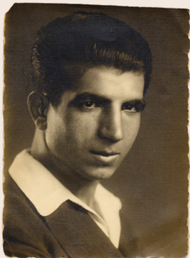
Missak Manouchian